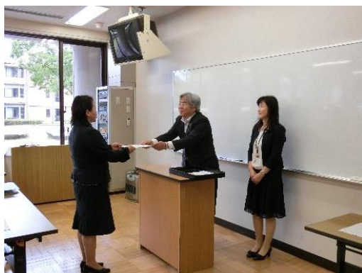
所長から研究協力校へ委嘱状を交付