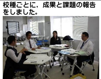
校種ごとに、成果と課題の報告をしました。