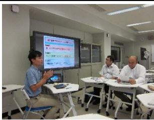
実践事例報告、刺激を受けました！