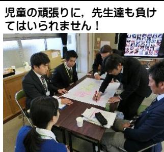
児童の頑張りにより、先生達も負けずにはられません！