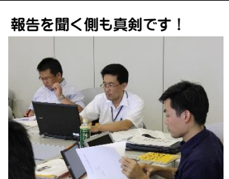
報告を聞く側も真剣です！