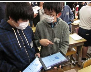
タブレットPCを使いこなし、考えを共有する児童にビックリ！

授業実践を積み重ねる中で、チャレンジを繰り返し、少しずつ授業改善していく様子が見られ、頼もしい12人の先生方です。