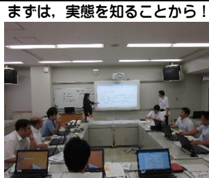
まずは、実態を知ることから！