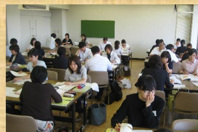
▲単元構成についての研究協議

研究協議では、身に付けさせたい資質・能力を明確にし、適切な言語活動を設定した単元構想を行いました。「評価や手立てについて、具体的な協議ができた」等前向きな感想が多く見られました。