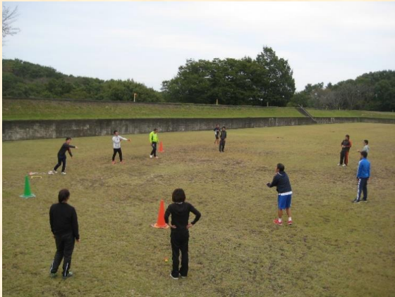
▲体育：グラウンドでの実技研修

6年次研修（小学校）第5日は、受講者が選択した教科ごとに分かれて研修を行いました。