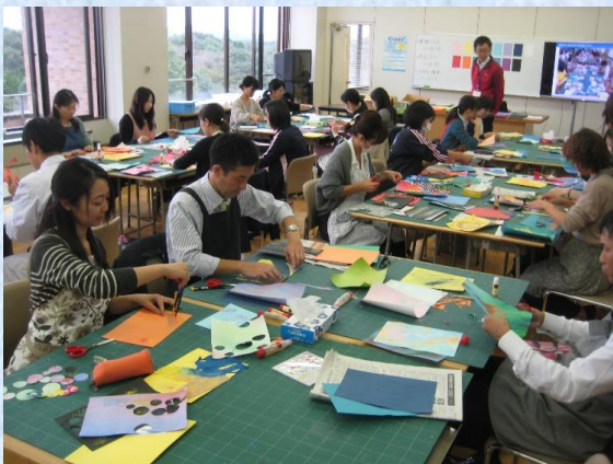
▲図工：コラージュ作品の制作