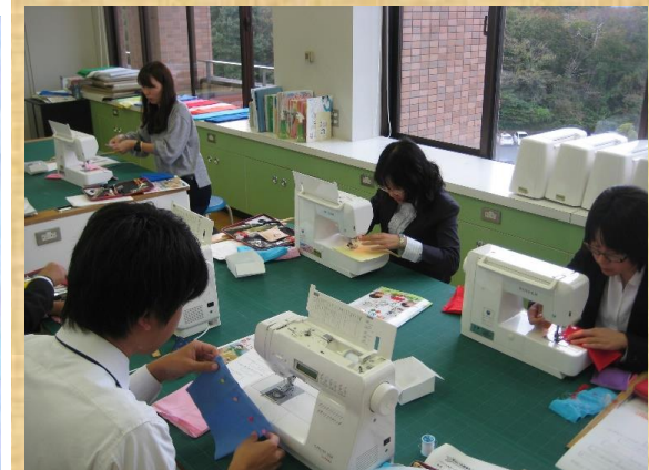
▲家庭：ミシンを使った巾着作り

受講者からは、「『見えることから見えないものを見つけ出す』という視点がとても興味深かった。これからの社会を生きる子どもたちに『考える力』をつけるために大切な視点だと感じた。（社会）」、「伝統音楽に触れて楽しさを実感することができた。子供たちの輝く表情が目についた。（音楽）」等の感想が寄せられました。今後の授業作りに向けて、充実した研修となりました。