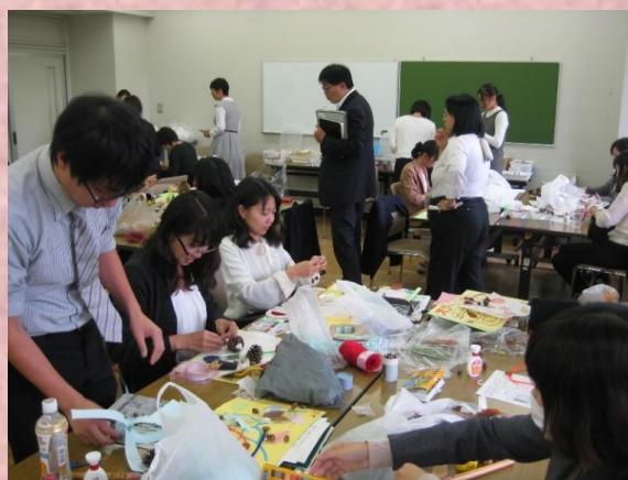
▲生活：木の実などを使ってのおもちゃ作り