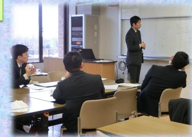
▲ホワイトボードを使っての説明も