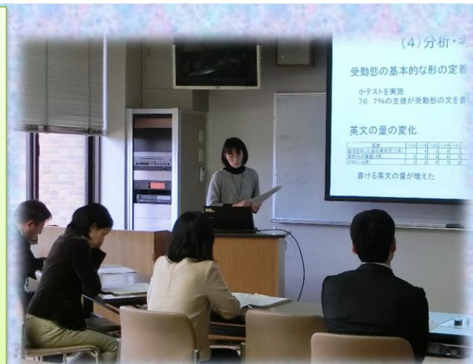
▲生徒の変容について考察しました

2月2日（金）（音楽は、2月14日（水））に、中堅教諭等資質向上研修講座（高等学校）第8日を実施しました。この日は、研修の最終日で、教科指導についての課題研究の発表を行いました。約半年の研究の成果を、緊張しながらも精一杯伝える姿が印象的でした。受講者からは、「実態をしっかりと捉え、何をどう達成させ、それをどう検証するのかという方法や視点を学ぶことができた。」「研修を通して、中堅教諭として考え方が変化してきたと感じた。」等の意見が寄せられました。