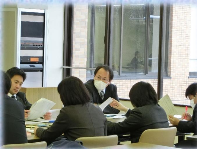
▲真剣な表情で協議しています