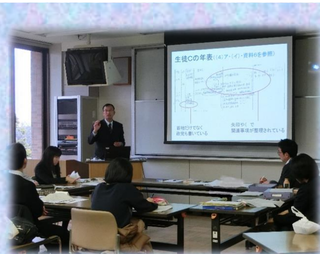
▲記述を細かく分析しています

2月2日（金）（音楽は、2月14日（水））に、中堅教諭等資質向上研修講座（高等学校）第8日を実施しました。この日は、研修の最終日で、教科指導についての課題研究の発表を行いました。約半年の研究の成果を、緊張しながらも精一杯伝える姿が印象的でした。受講者からは、「実態をしっかりと捉え、何をどう達成させ、それをどう検証するのかという方法や視点を学ぶことができた。」「研修を通して、中堅教諭として考え方が変化してきたと感じた。」等の意見が寄せられました。