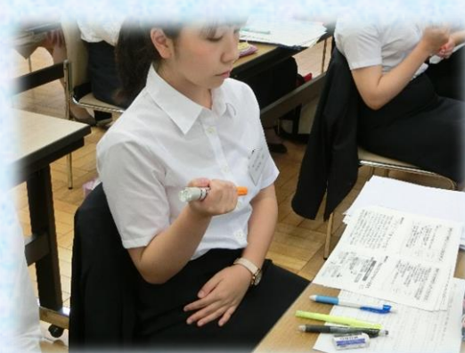
▲講義「学校給食関連事故発生時の対応」 エピペントレーナーを使用しての演習の様子