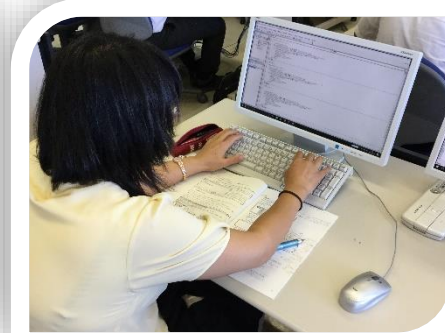
VBAによるプログラミング