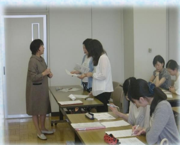
▲演習「健康相談」の様子