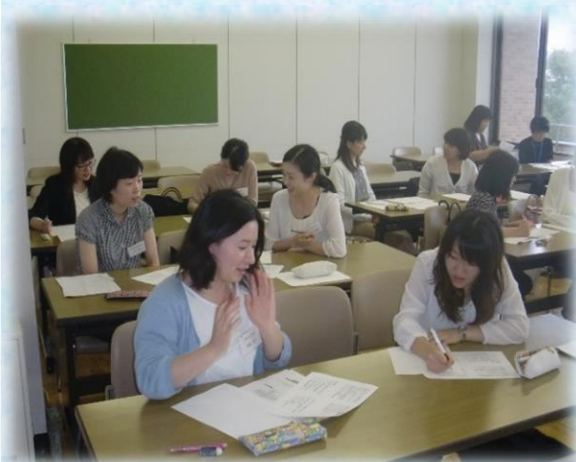
▲演習「健康相談」の様子