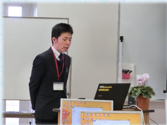
水戸市立国田義務教育学校