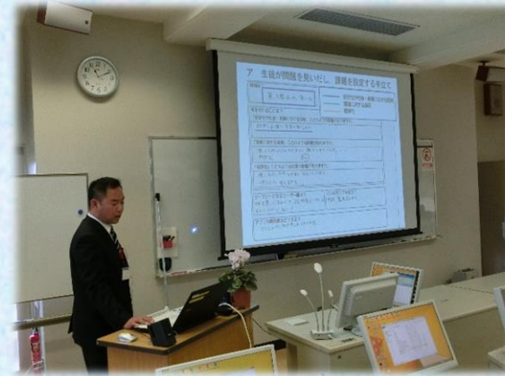
笠間市立岩間中学校