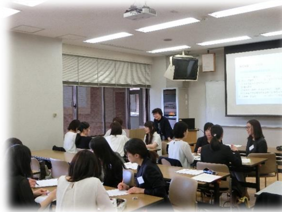
研究協議「保健室経営を振り返って」の様子